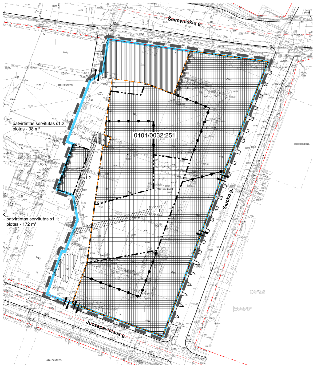
SCHEMA NR. 1

SKLYPO A. JUOZAPAVIČIAUS G. 6/ ŠEIMYNIŠKIŲ G. 3, 3A DETALIUOJU PLANU NUSTATYTOS STATYBOS ZONOS, RIBOS, SERVITUTAI, ĮVAŽIAVIMAI IR IŠVAŽIAVIMAI