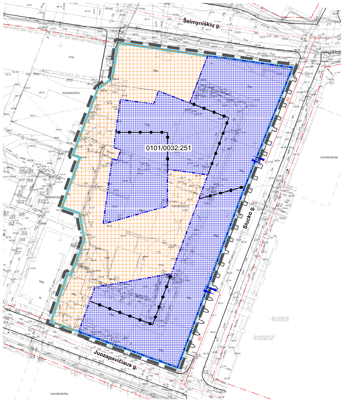
SCHEMA NR. 2

PLANUOJAMOS STATYBOS ZONOS IR RIBOS, ĮVAŽIAVIMAI IR IŠVAŽIAVIMAI