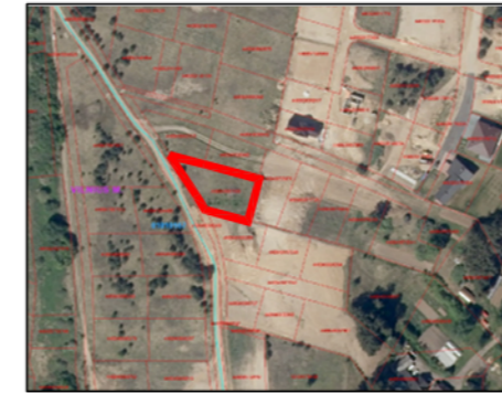
IŠTRAUKA IŠ GEOPORTAL ŽEMĖLAPIO SU PLANUOJAMU SKLYPU