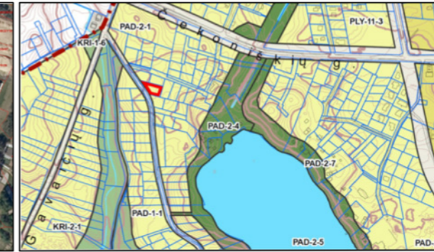
IŠTRAUKA IŠ VILNIAUS M. SAVIVALDYBĖS TERITORIJOS BENDROJO PLANO SU PLANUOJAMU SKLYPU