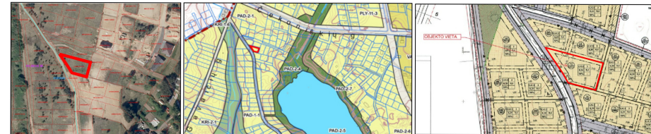
1. IŠTRAUKA IŠ GEOPORTAL ŽEMELAPIO SU PLANUOJAMU SKLYPU 2. IŠTRAUKA IŠ VILNIAUS M. SAVIVALDYBĖS TERITORIJOS BENDROJO PLANO SU PLANUOJAMU SKLYPU 3. IŠTRAUKA IŠ TERITORIJŲ TIES PADEKANIŠKIŲ, ČEKONIŠKIŲ IR GERYČIŲ GATVĖMIŠ, VILNIAUS M. SAV. DETALIOJO PLANO SU PLANUOJAMU SKLYPU