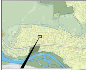
PLANUOJAMA TERITORIJA SITUACIJOS SCHEMA (VILNIAUS M. SAV. TERIT. BP KONTEKSTE)

Vilniaus miesto savivaldybės tarybos 2013 m. birželio 5 d. sprendimu Nr. 1-1259 „Dėl apie 5,7 ha teritorijos tarp Pavilnių regioninio parko ir A. Kojelavičiaus gatvės detaliojo plano tvirtinimo“ detaliojo plano koregavimas sklype Nr. 38 (statinių statybos zonos, ribos, susisiekimo komunikacijų išdėstymo principų koregavimas sklype: adresu A. Kojelavičiaus g. 90, Vilnius)