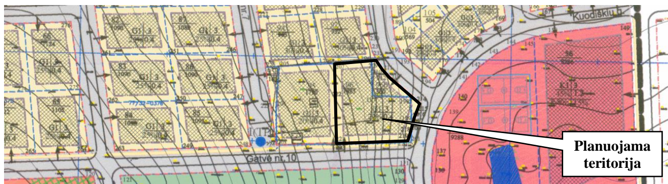
1 pav. Ištrauka iš Detaliojo plano pagrindinio brėžinio

Vadovaujantis Detaliojo plano sprendiniais Planuojamos teritorijos Žemės sklypui yra nustatyti šie teritorijos tvarkymo ir naudojimo režimo reikalavimai: Plotas – 1885 m 2 ; Paskirtis – kita; Naudojimo būdas – gyvenamosios teritorijos (indeksas G); Naudojimo pobūdis – mažaaukščių gyvenamųjų namų statybos (indeksas G1); Statinio aukštų skaičius – iki 3 aukštų; Statinio aukštis nuo žemės paviršiaus – iki 11 m; Užstatymo tankis – iki 20 %; Užstatymo intensyvumas – iki 0,4; Užstatymo riba – ne arčiau 4 metrų nuo sklypo ribos.