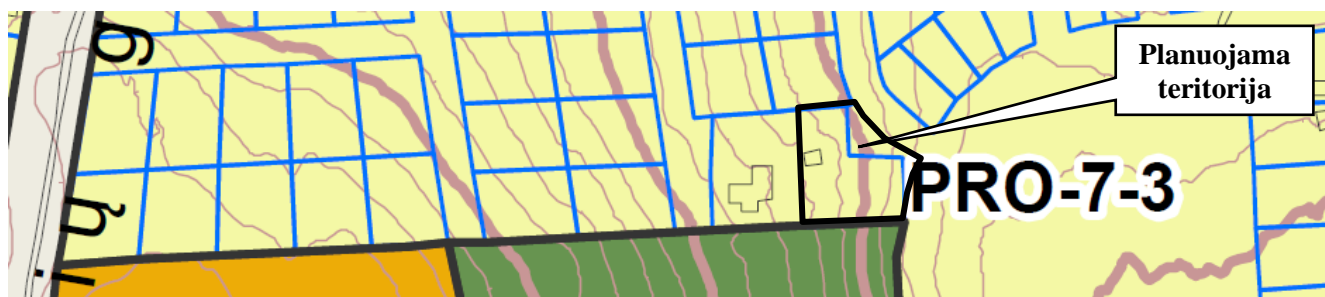
2 pav. Ištrauka iš Bendrojo plano pagrindinio brėžinio

Vadovaujantis Bendrojo plano sprendiniais Žemės sklypas patenka į mažo užstatymo intensyvumo gyvenamąją zoną Nr. PRO-7-3 ir jam taikomi šie teritorijos tvarkymo ir naudojimo režimo reikalavimai: Funkcinės zonos Nr. – PRO-7-3; Funkcinės zonos pavadinimas – mažo užstatymo intensyvumo gyvenamoji zona; Teritorijos naudojimo tipas – GV;GM;PA;SI; Pagrindinė žemės naudojimo paskirtis – kita; Žemės naudojimo būdas – G1;K;V;R;B;I2;E; Didžiausias leistinas pastatų aukštų skaičius – 3; Didžiausias leistinas pastatų aukštis nuo žemės paviršiaus – 12 m; Užstatymo tipas – vd; Didžiausias leistinas sklypo užstatymo intensyvumas – 0.4; Didžiausias leistinas sklypo užstatymo tankis – 40; Mažiausias sklypo plotas naujai statybai – 400; Didžiausias būstų skaičius sklype – 2; Didžiausia nelaidžių dangų ploto dalis sklype, kuriai netaikomos kompensacinės priemonės – 40%; Didžiausias galimas vieno mažmeninės prekybos objekto bendras plotas – 500 m 2 . Tekstinis reglamentas Nr. 39 – Gyvenamosiose ir centrų funkcinėse zonose, nepatenkančiose į žaliųjų plotų pasiekiamumo zoną (pagal BP Žaliųjų plotų pasiekiamumo schemą), rengiant vietovės lygmens TPD, numatyti sklypą (-us) atskiriesiems želdynams. Tais atvejais, kai atskirųjų želdynų