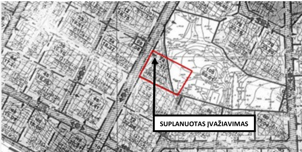
11.1. pav. Detaliojo plano brėžinio fragmentas su koreguojama teritorija.

11. Įvažiavimo į sklypą koregavimo sprendiniai. Pirminiame detalajame plane suplanuotas įvažiavimas į koreguojamą sklypą Pijų g. 8 iš Didžiųjų Gulbių gatvės naikinamas. (žiūr. 11.1 pav.). Planuojamas naujas įvažiavimas / išvažiavimas į sklypą iš esamo akligatvio pagal galiojantį žemės sklypų formavimo ir pertvarkymo projektą.