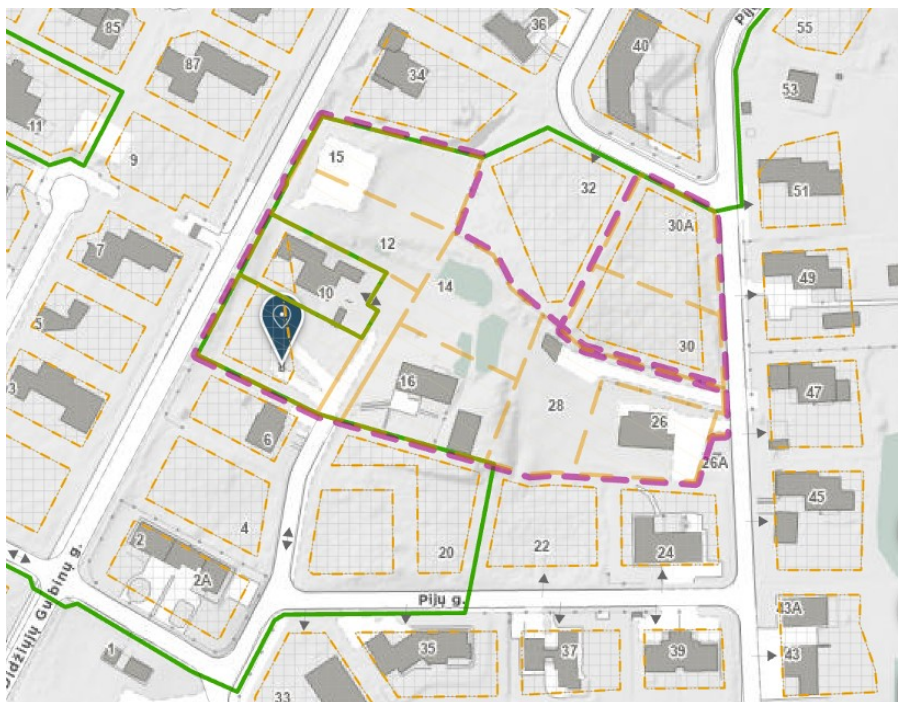
3.2 pav. Schema su patvirtinto ZSFP-42647 projekto riba ir su suformuotų sklypų ribomis. Ištrauka iš Vilniaus m. interaktyvaus žemėlapio.