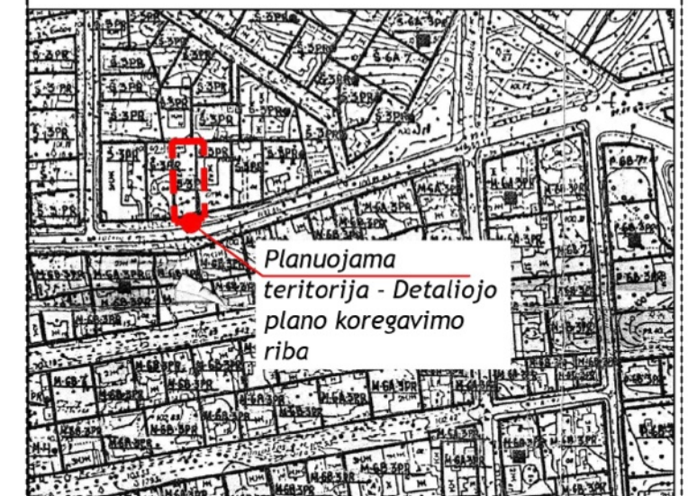
Štrauka iš patvirtinto Žvėryno rajono plano