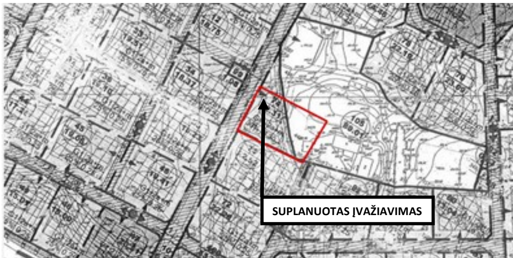
11.1. pav. Detaliojo plano brėžinio fragmentas su koreguojama teritorija.

11. Suplanuoti susisiekimo sprendiniai (nekoreguojami) lieka galioti pagal pirminio detaliojo plano sprendinius. Pirminiame detalajame plane yra suplanuotas įvažiavimas į koreguojamą sklypą Pijų g. 8 iš Didžiųjų Gulbinų gatvės. (žiūr. 11.1 pav.). Rengiamame statybos projekte numatytas įvažiavimas iš akligatvio pagal galiojantį žemės sklypų formavimo ir pertvarkymo projektą. Todėl sklypui Pijų g. 8 yra patvirtinti ir galimi du įvažiavimai.