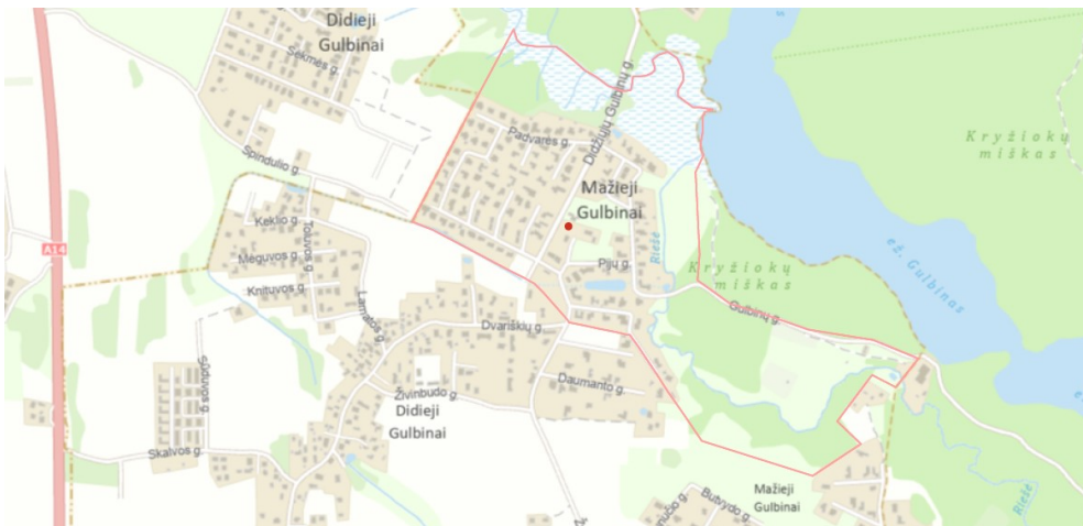
2.1 pav. Situacijos schema su Detaliojo plano galiojimo riba.

2. Koreguojama teritorija yra šiaurinėje Vilniaus miesto dalyje Verkių seniūnijoje, Mažųjų Gulbinų rajone.