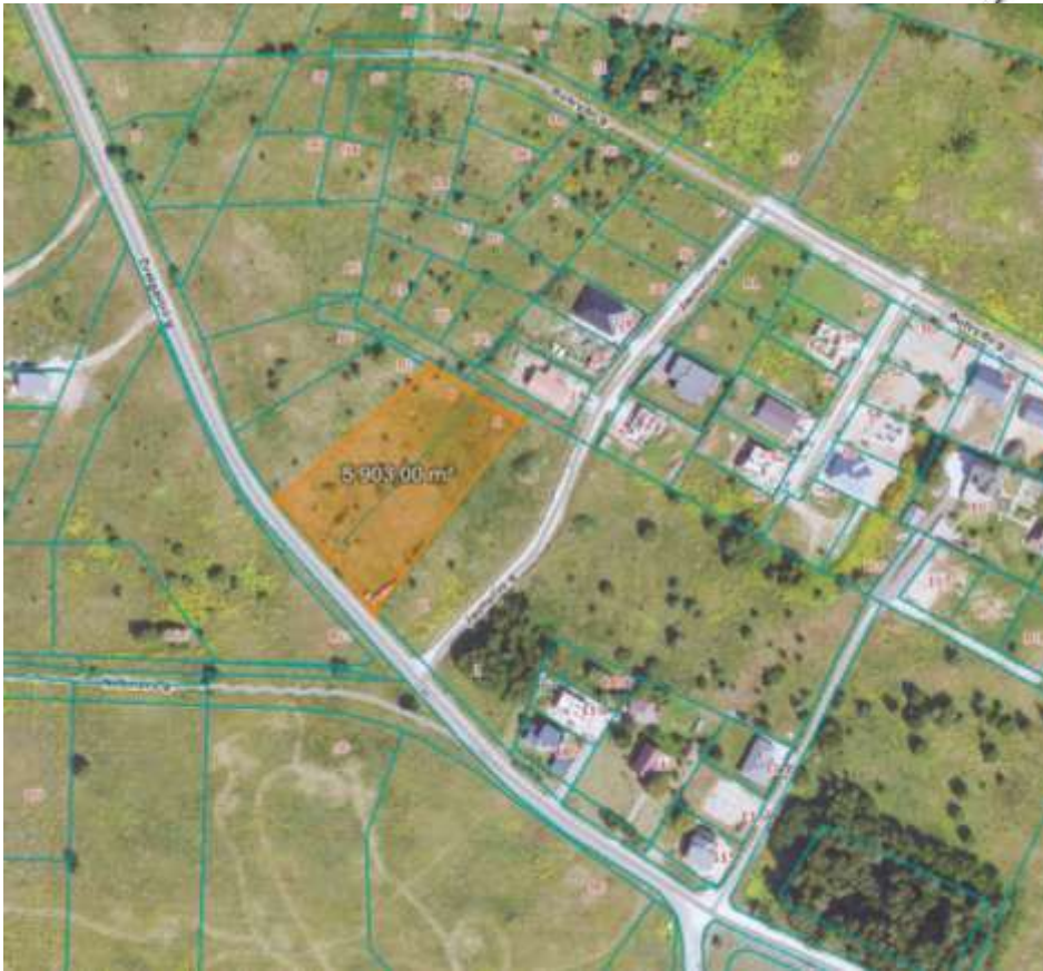
2 pav. Situacijos schema. — planuojama teritorija

Planuojamos teritorijos plotas 0,5988 ha, pagrindinė naudojimo paskirtis – kita; naudojimo būdas – daugiabučių gyvenamųjų pastatų ir bendrabučių teritorijos. Žemės sklypai suformuoti atliekant kadastrinius matavimus, matavimai vykdyti valstybinėje LKS-94 koordinatų sistemoje.