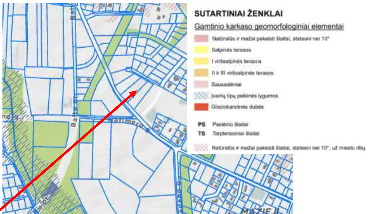
5 pav. Bendrojo plano ištrauka. Geomorfologiniai gamtinio karkaso elementai

36-Teritorijai ar jos daliai (pagal BP brėžinį Geomorfologiniai gamtinio karkaso elementai) taikyti Sausaslėnių apsaugos ir tvarkymo reglamentą; 38-Teritorijai ar jos daliai (pagal BP brėžinį Geomorfologiniai gamtinio karkaso elementai) taikyti Glaciokarstinių dubių apsaugos ir tvarkymo reglamentą;