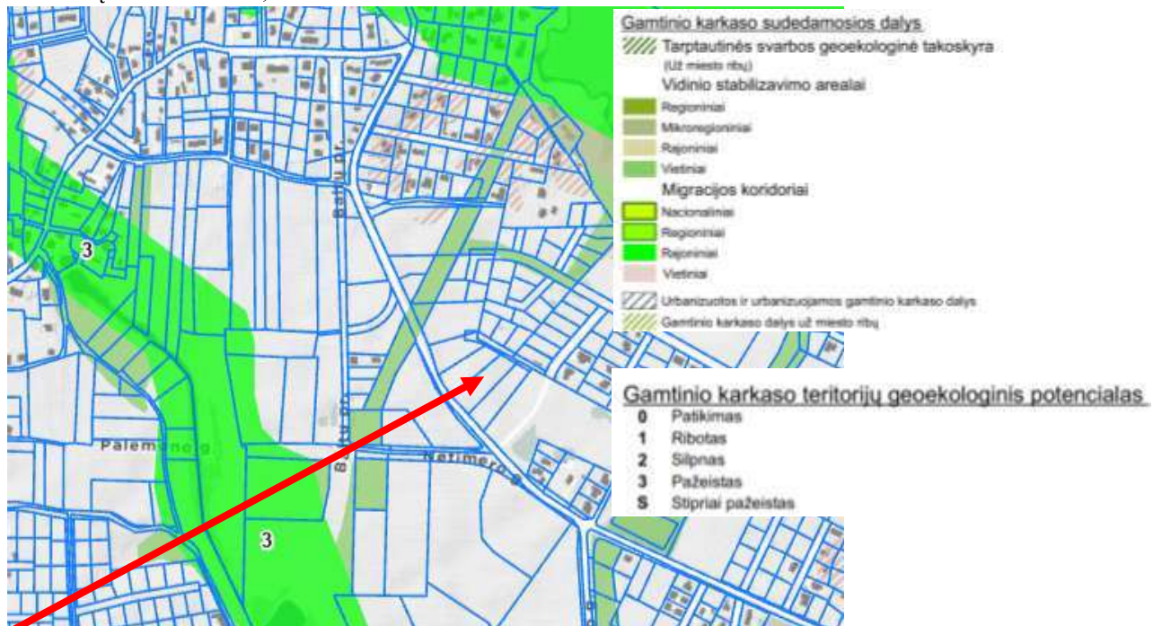
4 pav. Bendrojo plano ištrauka. Gamtinio karkaso schema

32-Teritorijai ar jos daliai (pagal BP Gamtinio karkaso schemą) taikyti Gamtinio karkaso nuostatų reikalavimus;