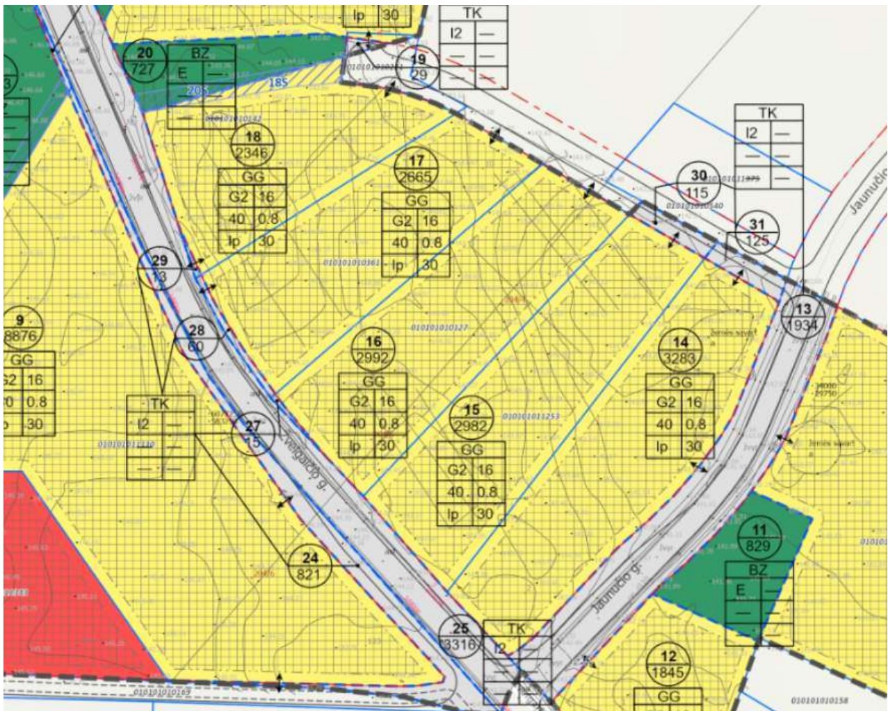
1 pav. Ištrauka iš Detaliojo plano projekto.

Vilniaus miesto savivaldybės tarybos 2013-10-30 sprendimu Nr. 1-1535 patvirtintu Detalioju planu, suplanuoti žemės sklypai, esantys Jaunučio g. 6, 8.