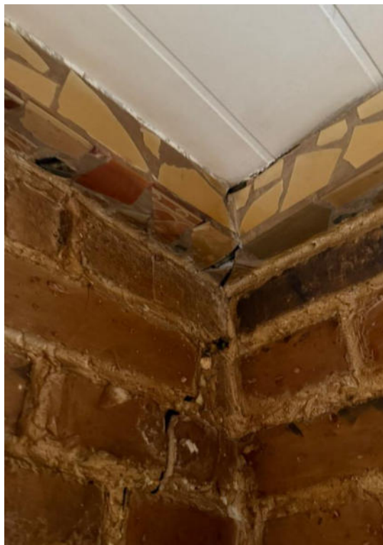
pav. 12 Užfiksuoti trūkiai sienų kampuose.