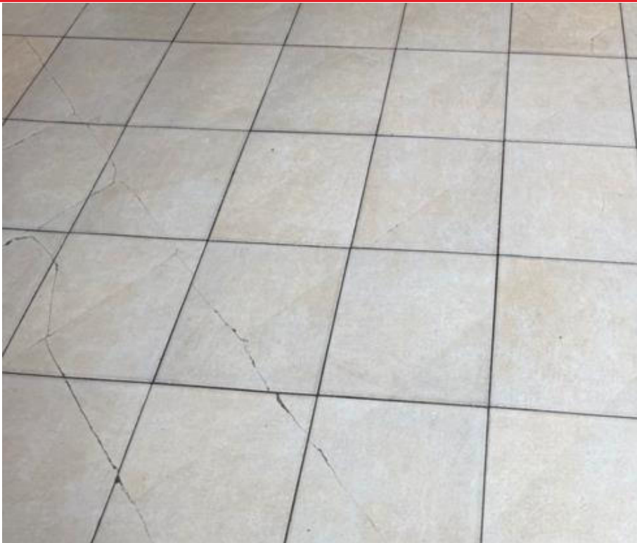
pav. 1 Grindų plytelių trūkiai