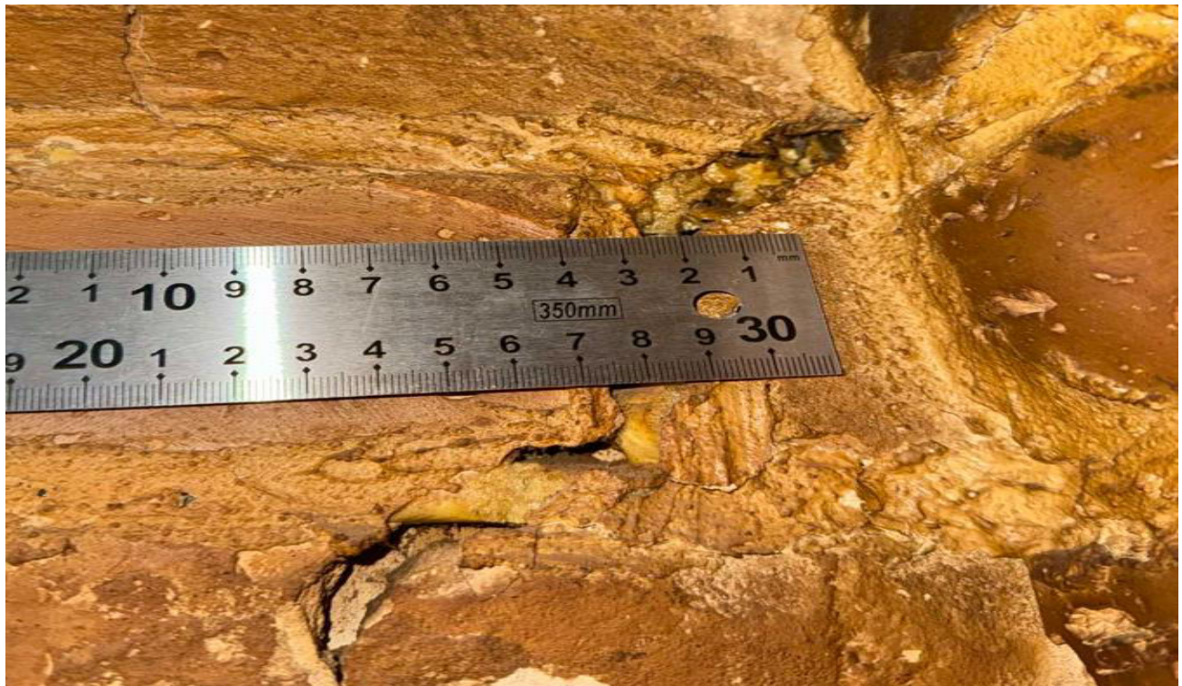
pav. 10 Užfiksuoti trūkiai sienų kampuose.