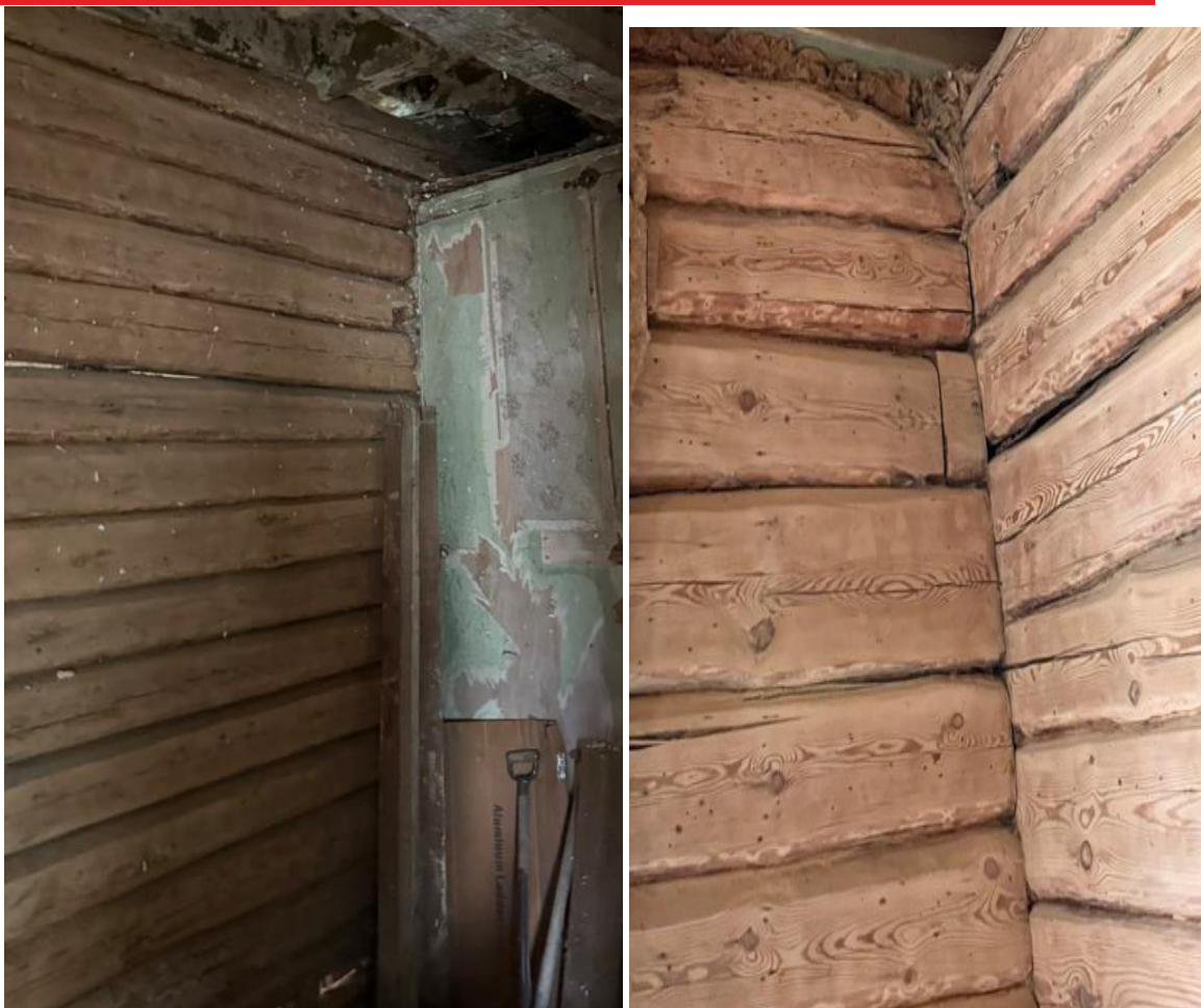
pav. 8 Rąstinėse sienose esminių konstrukcinių pažeidimų neužfiksuota