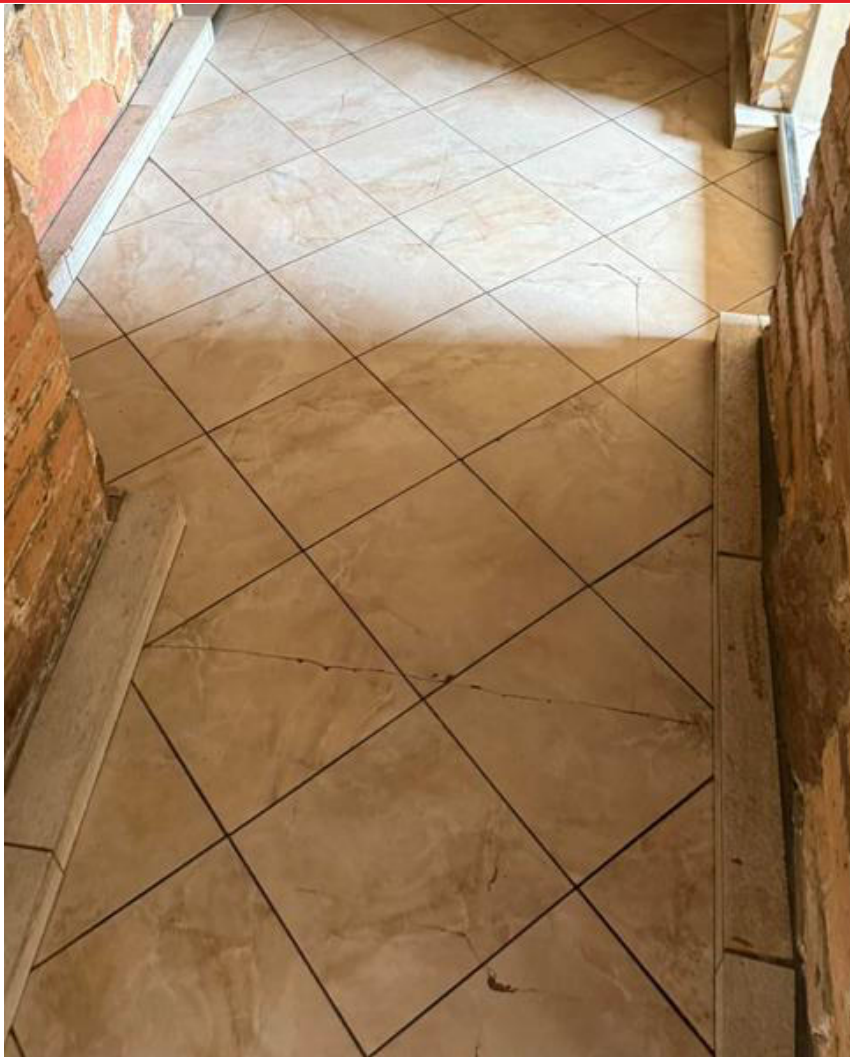
pav. 3 Grindų plytelių trūkiai

Atlikti grindų lygio matavimai kambariuose: