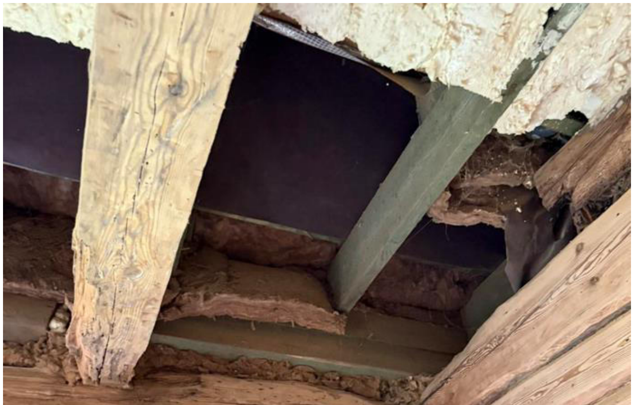
pav. 17 Medienos kampuose ir pakraščiuose pastebimos pažeistos medienos struktūros,