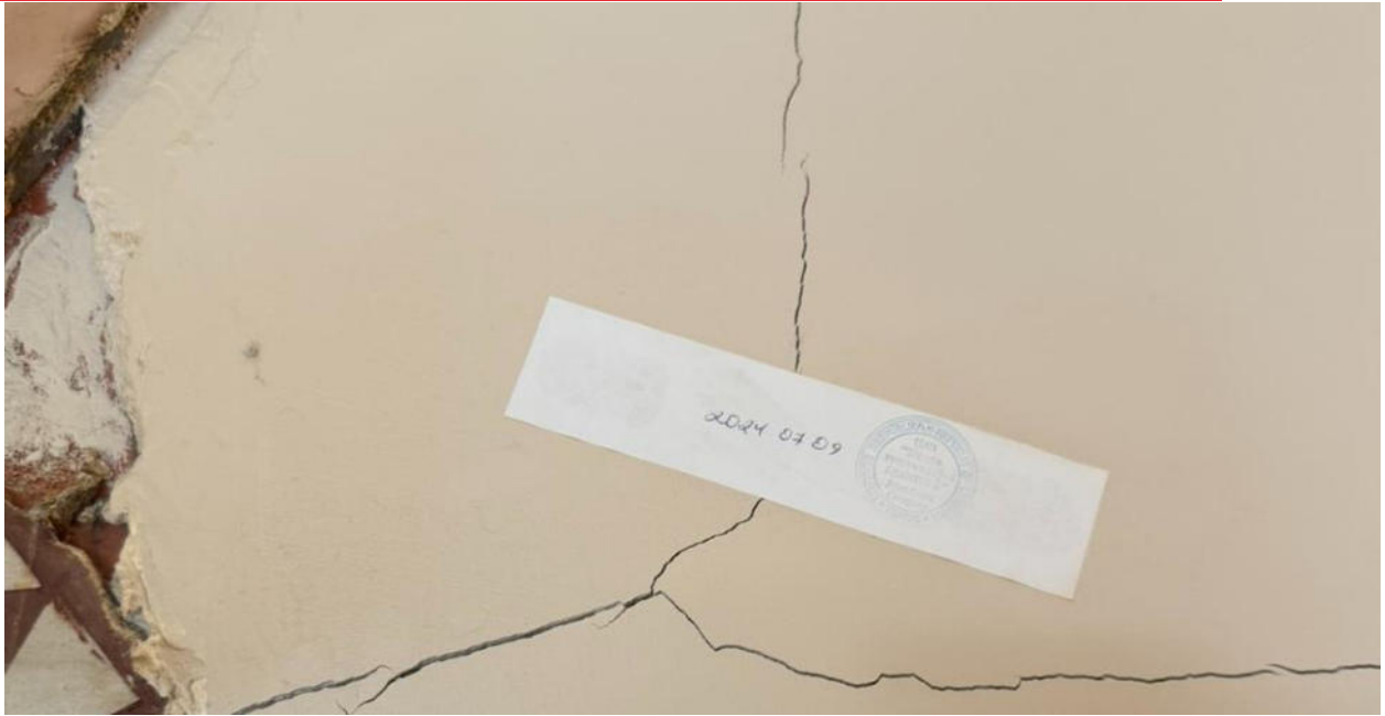
pav. 9 nuo 2024 m. stebima trūkių deformacija.