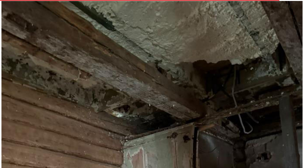
pav. 16 Ant sijų pastebima juoda mikrobiologinė danga, būdinga grybeliams, pelėsiams.