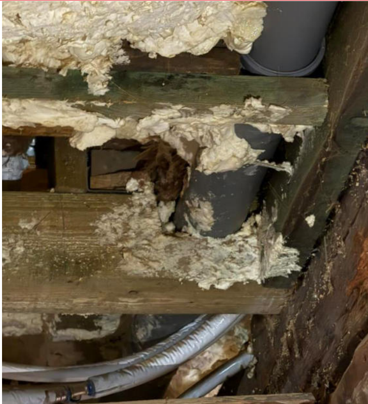
pav. 14 Sijų skerspjūvis tosiose vietose sumažintas apie 50 proc.