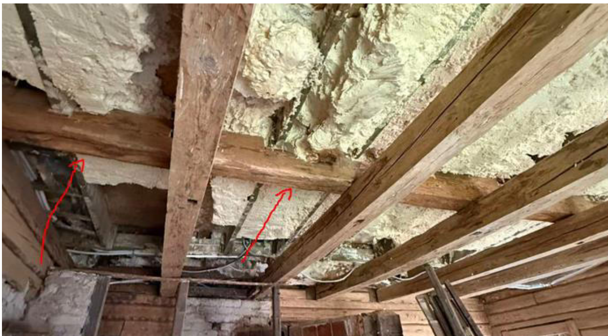
pav. 13 Deformuota bei puvinio pažeista sija.

Pirmo aukšto perdangos konstrukcijas sudaro medinės sijos, kurios remiasi į ant sienos sumontuotą medinį murlotą. Vietomis inžinerinės sistemos kerta laikančias sijas. Užfiksuota, žalsva ir juoda mikrobiologinė danga, būdinga grybeliams, pelėsiams bei samanoms. Medienos kampuose ir pakraščiuose pastebimos pažeistos medienos struktūros, kurios yra tipiškas medienos puvinio požymis. Kai kuriose vietose mediena suminkštėjusi, lengvai deformuojasi prispaudus, susidaro įdubimai – tai rodo, kad medžiaga prarado pirminį standumą. Pastebimi biologiniai ir mechaniniai sijų bei kitų konstrukcinių elementų pažeidimai, dėl kurių jų skerspjuviai sumažėję daugiau kaip 25 proc. todėl medinės perdangos laikomoji geba vertinama kaip nepatikima, o konstrukcijos – kaip galimai nesaugios naudoti.