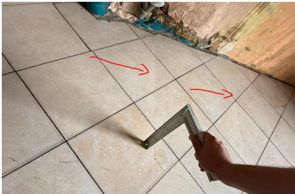
pav. 2 Grindų plytelių trūkiai