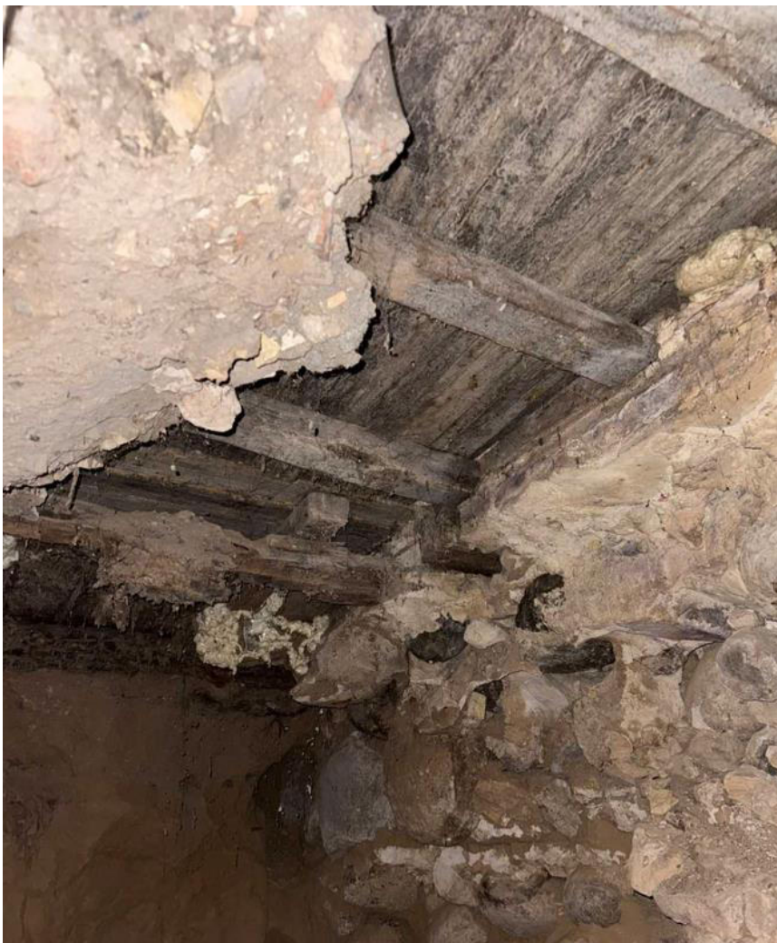
pav. 6 Rūsio perdangos konstrukcijos

Užfiksuota, žalsva ir juoda mikrobiologinė danga, būdinga grybeliams, pelėsiams bei samanoms, ypač drėgnose vietose. Medienos kampuose ir pakraščiuose pastebimos pažeistos medienos struktūros, kurios yra tipiškas medienos puvinio požymis. Kai kuriose vietose mediena suminkštėjusi, lengvai deformuojasi prispaudus, susidaro įdubimai – tai rodo, kad medžiaga prarado pirminį standumą. Pastebimi biologiniai ir mechaniniai sijų bei kitų konstrukcinių elementų pažeidimai, dėl kurių jų skerspjūviai sumažėję daugiau kaip 25 proc. todėl medinės perdangos laikomoji geba vertinama kaip nepatikima, o konstrukcijos – kaip galimai nesaugios naudoti.