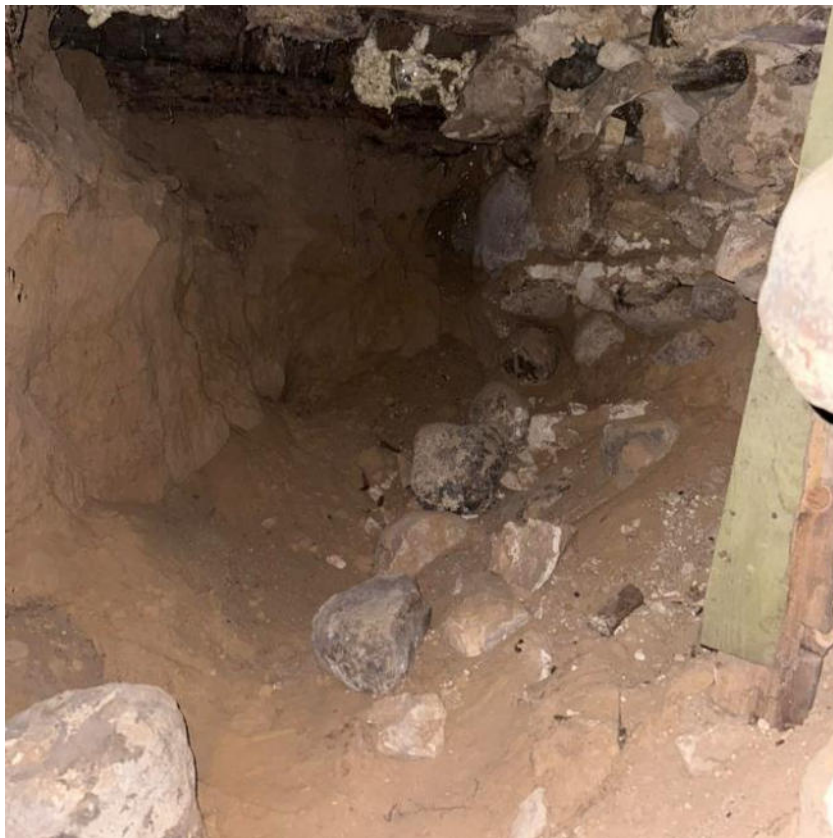
pav. 7 iškritę akmeninių pamatų akmenys

Vizualiai pamatų konstrukcija atrodo pažeista. Užfiksuoti iškritę akmeninių pamatų akmenys. Dėl ko yra sumažėjusi pamatų laikomoji galia, taip pat sumažėjęs perdangos konstrukcijų atramos plotas. Dėl šių pažeidimų virš pamato esančios sienos gali pradėti slinkti, trūkinėti ar deformuotis. Ilgainiui tai gali sukelti vis didesnę ardomąjį poveikį ir spartesnę degradaciją.