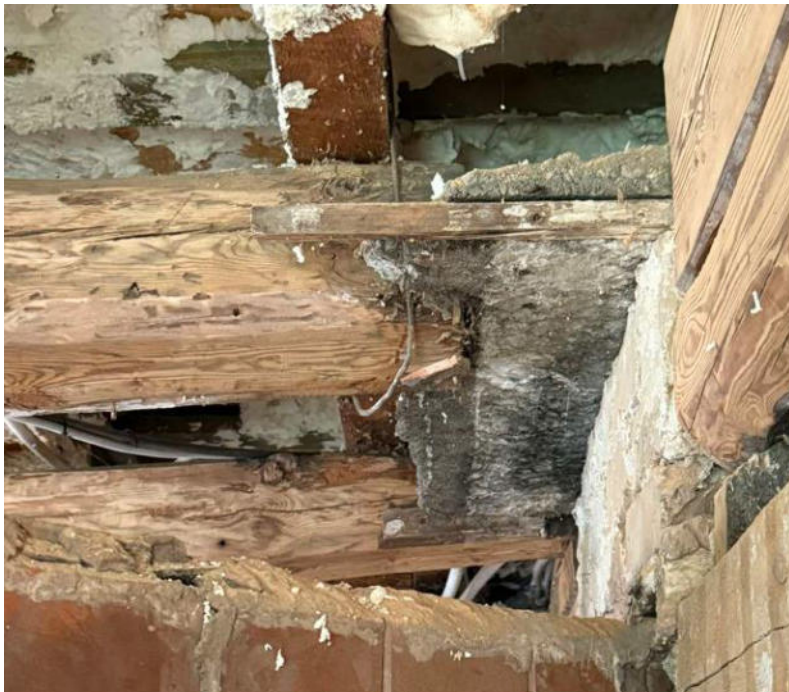
pav. 15 Pažeistos sijos.