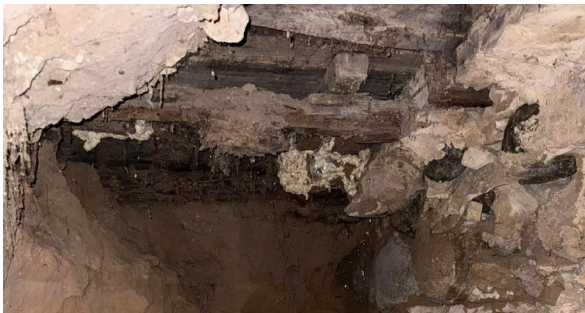
pav. 5 Rūsio perdangos konstrukcijos

Rūsio perdanga įrengta iš medinių konstrukcijų – medinių sijų sujungtų medinėmis lentomis.