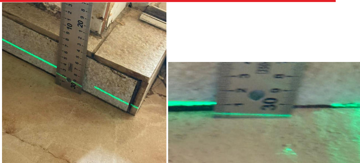
pav. 4 Skirtinguose kambarių kraštuose grindų lygis skiriasi 1,5 cm