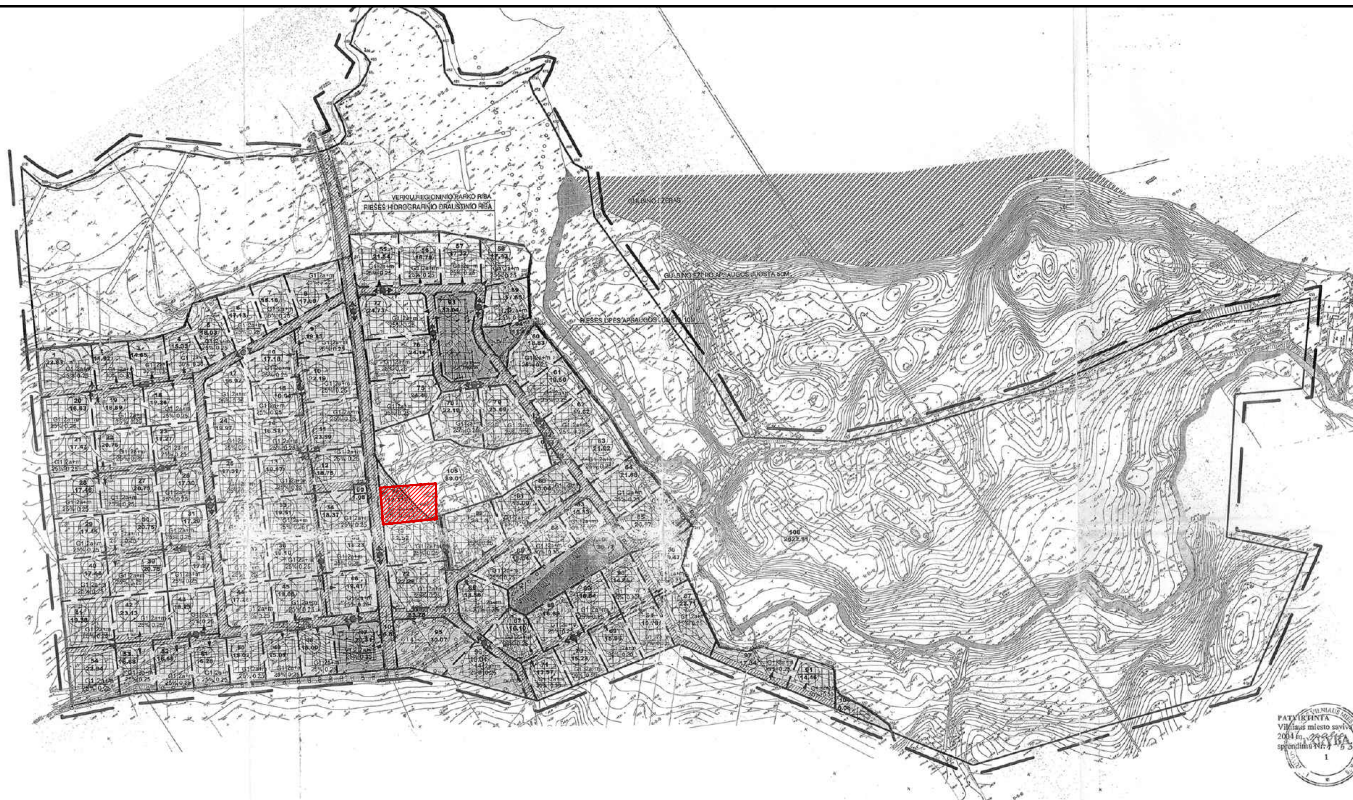
Detaliojo plano brėžinio fragmentas su pažymėta koreguojama teritorija