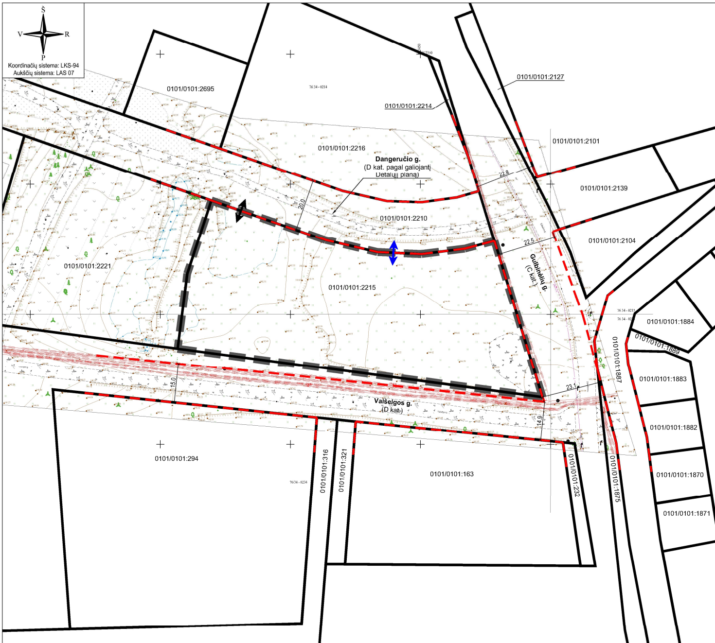
Teritorijos T-08 kvartalo buvusiame Didžiųjų Gulbinių detalusis planas, patvirtintas 2009-07-01 Vilniaus miesto savivaldybės tarybos sprendimu Nr. 1-1106 (TPD REG. NR. T00660006) (toliau - Detalusis planas)