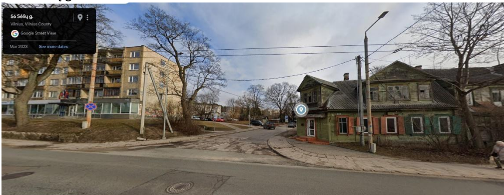
Arba palei Lapių g.: