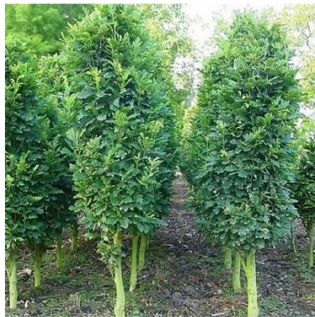
Kompensaciniams želdiniams numatyta vieta (už medžių pirmame plane)