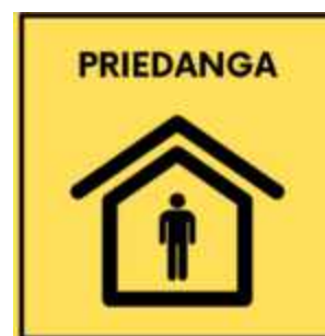
5 pav. Priedangos specialusis žymėjimo ženklas

37. Priedangų išsidėstymą žemėlapyje galima pamatyti internetinėje svetainėje, paspaudus čia .