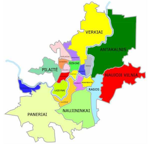
2 pav. Vilniaus miesto savivaldybės seniūnijos

3.7. Vilniaus miesto savivaldybės administracinis padalinimas apima 21 seniūniją (Plano 2 pav.): Antakalnio, Fabijoniškių, Grigiškių, Justiniškių, Karoliniškių, Lazdynų, Naujamiesčio, Naujininkų, Naujosios Vilnios, Panerių, Pašilaičių, Pilaitės, Rasų, Senamiesčio, Šeškinės, Šnipiškių, Verkių, Vilkpėdės, Viršuliškių, Žirmūnų, Žvėryno 1 . Seniūnijų kontaktiniai duomenys pateikti Plano 26 priede.