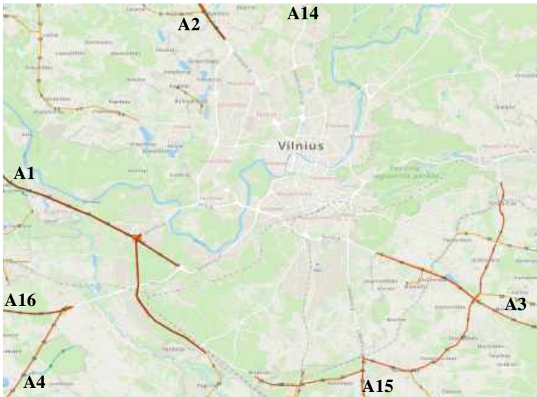
3 pav. Magistraliniai keliai, jungiantys Vilniaus miestą su kitais miestais

3.9. Automobilių magistralės jungia sostinę su visais Respublikos miestais ir rajonų centrais (Plano 3 pav.):