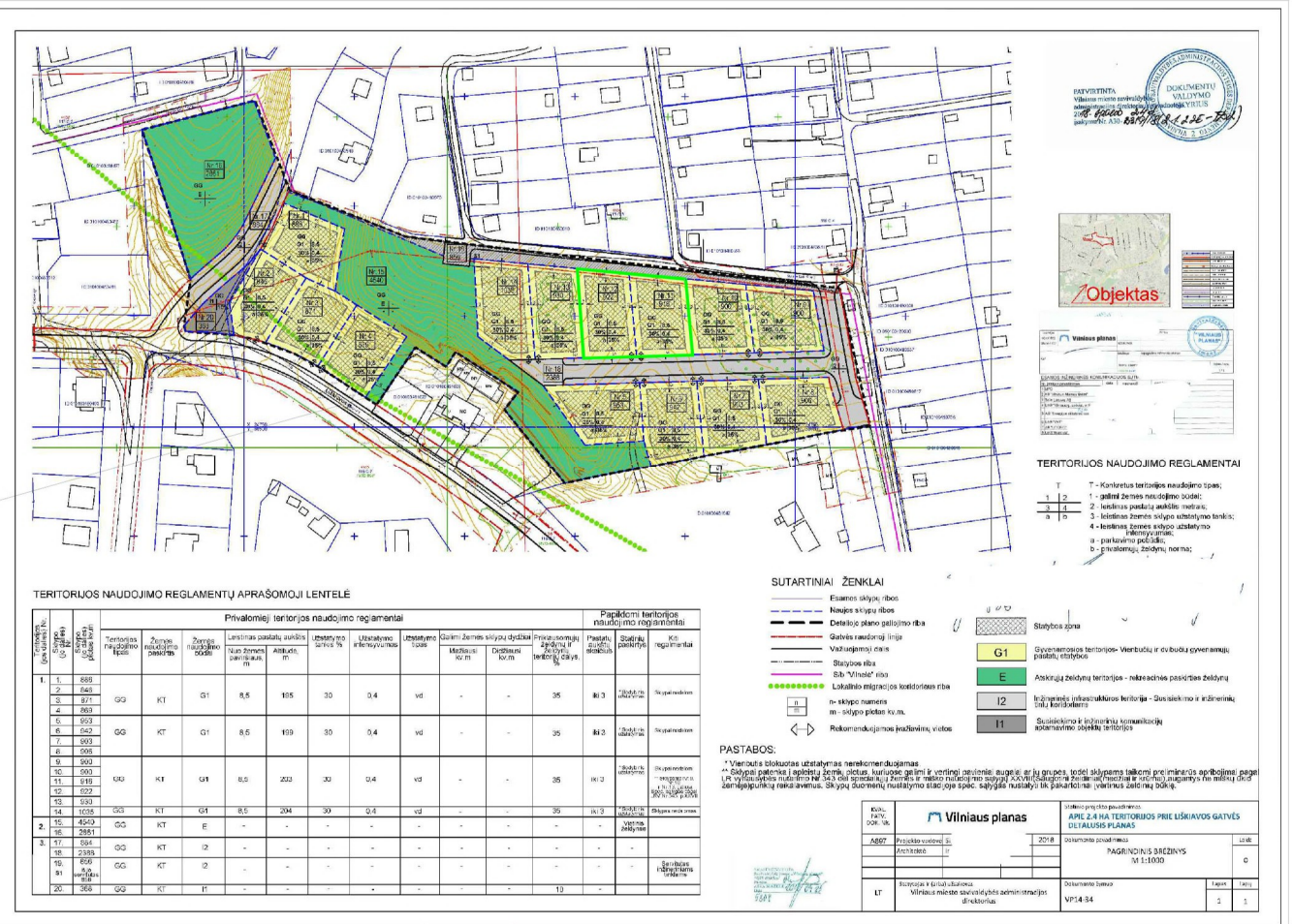
Apie 2,4 ha teritorijos prie Liškiavos gatvės detalusis planas