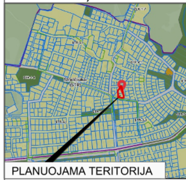
PLANUOJAMA TERITORIJA SITUACIJOS SCHEMA (VILNIAUS M. SAV. TERIT. BP KONTEKSTE)

Vilniaus miesto savivaldybės tarybos 2013 m. liepos 24 d. sprendimu Nr. 1-1407 „Dėl apie 29,6 ha ir 2,3 ha teritorijų šalia Džiaugsmo ir Strielčiųų gatvių detaliojo plano tvirtinimo“ detaliojo plano koregavimas sklypuose Nr. 43,44 (statinių statybos zonos, ribos, planuojamos teritorijos aprūpinimo inžineriniais tinklais koregavimas sklypuose: adresu J. Tūbelio g. 3,5, Vilnius)