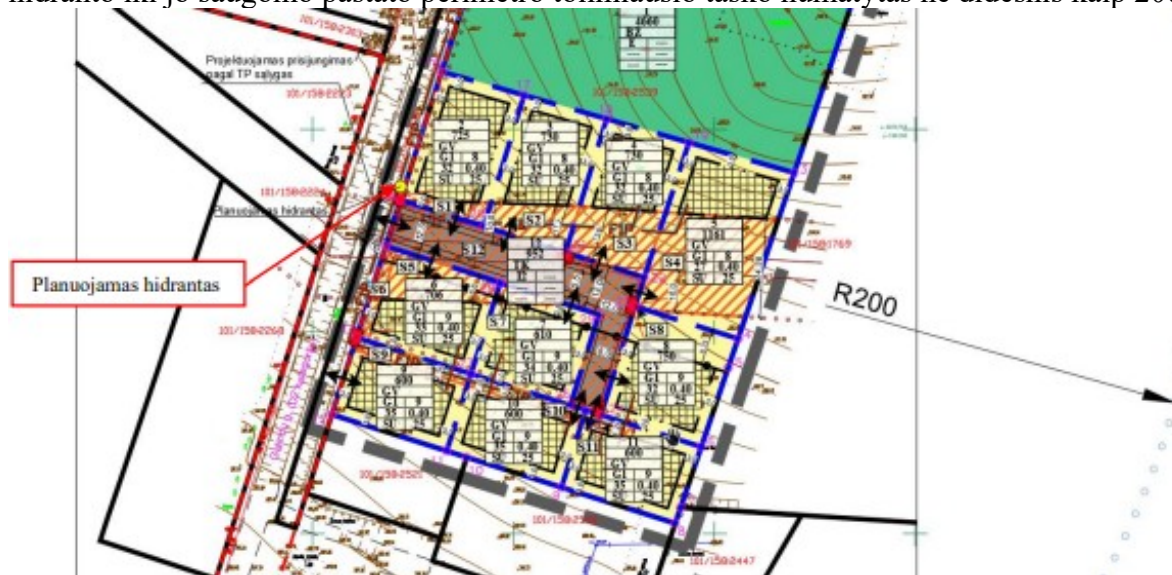
Ištrauka iš patvirtinto detaliojo plano koregavimo

Patvirtintu detaliojo plano koregavimu, vandens tiekimas gaisrams gesinti numatytas iš anksčiau suplanuoto vandens hidranto, greta Galindų gatvės. Atstumas nuo suplanuoto gaisrinio hidranto iki jo saugomo pastato perimetro tolimiausio taško numatytas ne didesnis kaip 200 m.