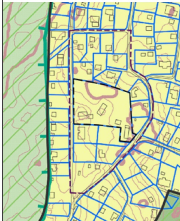
IŠTRAUKA IŠ VILNIAUS MIESTO SAV. TERITORIJOS BENDROJO PLANO, T00086338, patv. 2021 m. birželio 2 d., Vilniaus miesto savivaldybės tarybos sprendimu Nr. 1-972