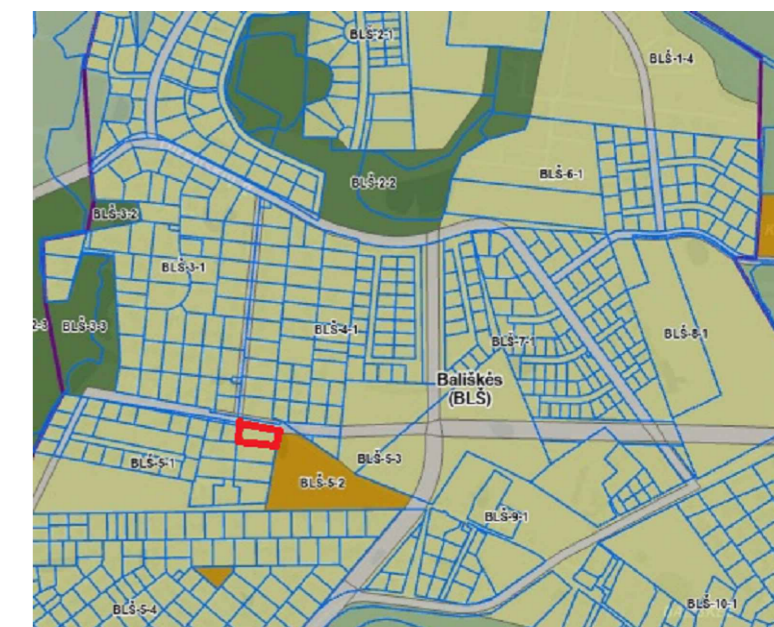
Ištrauka iš Vilniaus miesto savivaldybės teritorijos bendrojo plano pagrindinio brėžinio iki 2030

Detaliojo plano rengimo pagrindas - Vilniaus miesto savivaldybės administracijos direktoriaus 2024-09-16 įsakymas Nr. 30-2359/24 "dėl leidimo koreguoti teritorijos Mačiuliškių kaime, Vilniuje, nedidelių veiklos mastų detaliojo plano sprendinius sklype Nr. 48 (kadastro Nr. 0101/0165:611) inicijavimo sutarties pagrindu"