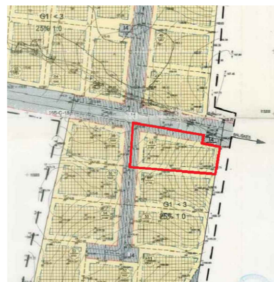
Detaliojo plano ištrauka