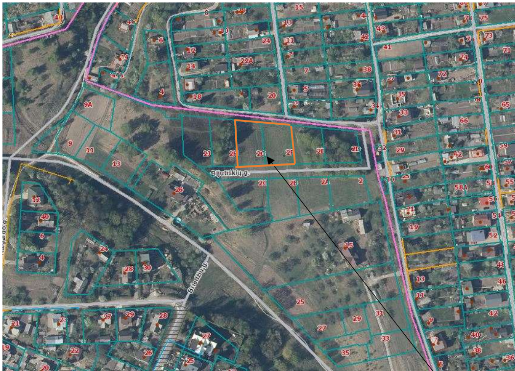
Planuojamos teritorijos vieta

Planuojami žemės sklypai yra rytinėje Vilniaus miesto dalyje, Naujosios Vilnios seniūnijos teritorijoje, Šiaurės Sodų 6-ojoje gatvėje. Žemės sklypai, Šiaurės sodų 6-oji g. 2F ir 2G yra naujai detaliuojami planu suformuotame gyvenamajai statybai skirtame kvartale, kuriame tik pradeda kurtis naujakuriai. Toliau aplinkinė teritorija yra pilnai išsivysčiusi, vyrauja sodybinis užstatymas, sodo ir vienbučiai namai. Šalia planuojamos teritorijos yra pakloti elektros tinklai. Šiaurinėje pusėje planuojama teritorija ribojasi su Sodininkų bendrija „Vilnelė“. 1 pav. pateikiama planuojamos teritorijos situacijos schema.