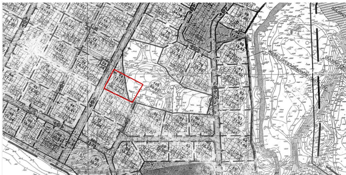
2.2. pav. Detaliojo plano statybos riba ir statybos zona koreguojama sklype Pijų g. 8 Detaliojo plano brėžinio fragmentas su koreguojama teritorija.