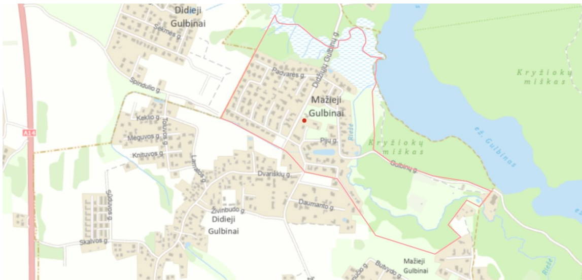
2.1 pav. Situacijos schema su DP galiojimo riba.

2. Koreguojama teritorija yra šiaurinėje Vilniaus miesto dalyje Verkių seniūnijoje, Mažųjų Gulbinų rajone, ji patenka į 2004 m. spalio 13 d. patvirtinto detaliojo plano, reg. Nr. T00055861, galiojimo ribas.