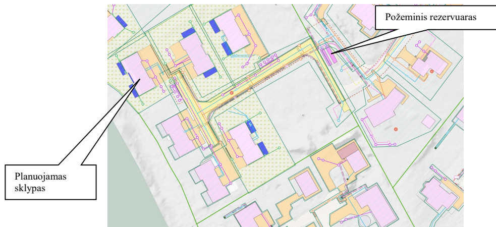
Ištrauka iš Vilniaus interaktyvaus žemėlapio