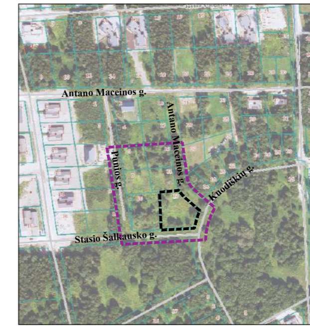
Planuojamos ir nagrinėjamos teritorijų vieta