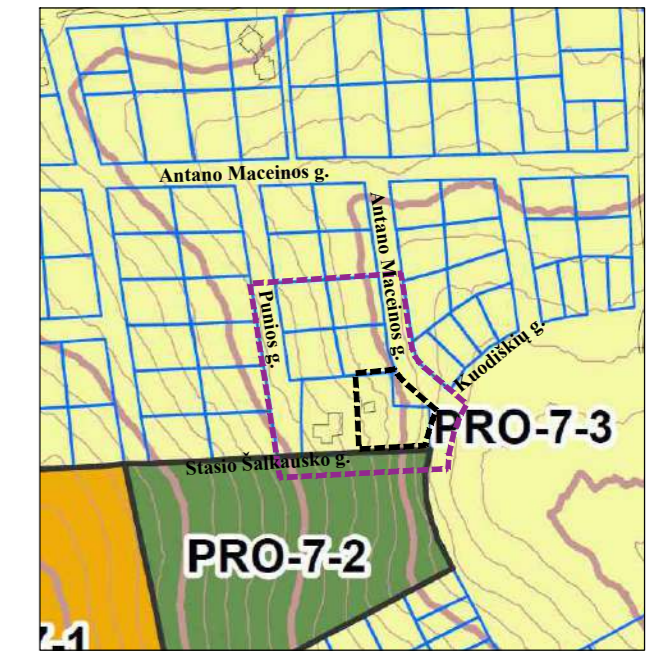
Ištrauka iš Vilniaus miesto savivaldybės teritorijos bendrojo plano pagrindinio brėžinio