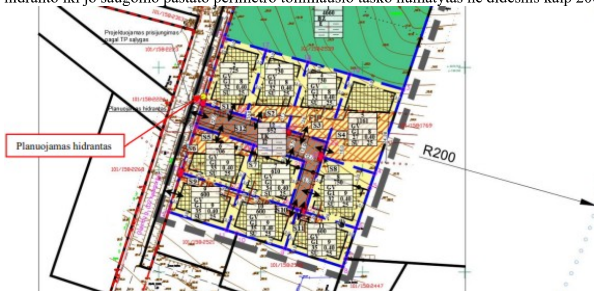
Ištrauka iš patvirtinto detaliojo plano koregavimo

Patvirtintu detaliojo plano koregavimu, vandens tiekimas gaisrams gesinti numatytas iš anksčiau suplanuoto vandens hidranto, greta Galindų gatvės. Atstumas nuo suplanuoto gaisrinio hidranto iki jo saugomo pastato perimetro tolimiausio taško numatytas ne didesnis kaip 200 m.