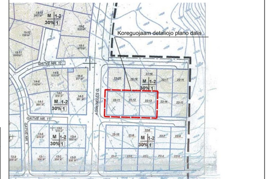
ISTRAUKA IŠ VILNIAUS MIESTO SAVIVALDYBĖS TARYBOS 2001 M. LIEPOS 25 D. SPRENDIMU NR. 388 PATVIRTINTO NEMĖŽIO PIRMOJO MIKORAJONO ŠIAURINĖS DALIES TERITORIJOS DETALIOJO PLANO (REGISTRO NR. 771) PAGRINDINIO BRĖŽINIO