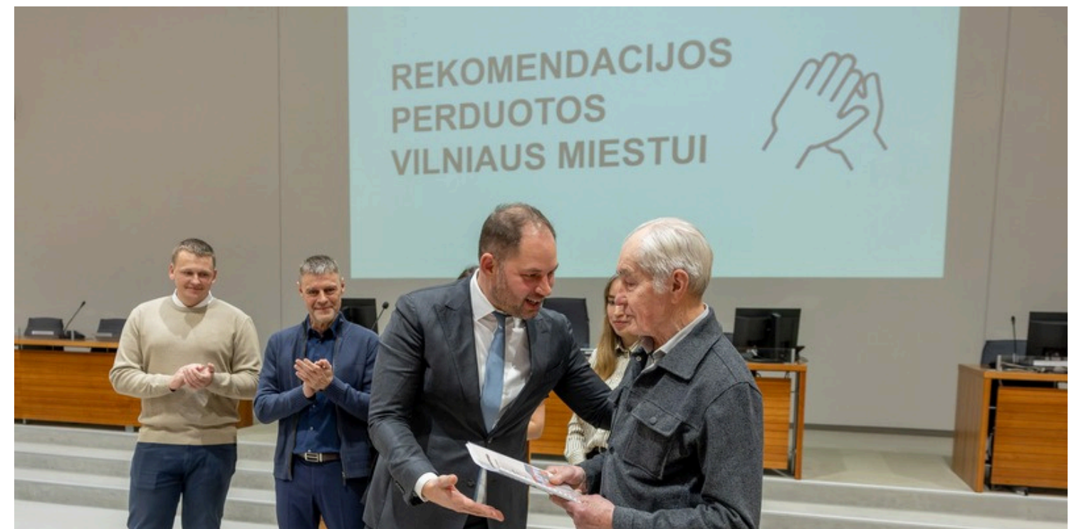
Piliečių asamblėjos dalyviai ir rekomendacijų perdavimo savivaldybei šventės akimirkos.