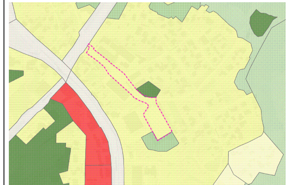
Ištrauka iš 2021-06-02 Vilniaus miesto tarybos sprendimu Nr. I-972 patvirtinto Vilniaus miesto savivaldybės teritorijos bendrojo plano keitimo