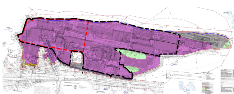
Šiurkava iš Žemės sklypo Vilniaus g. 10 (kad. Nr. 7937/0001-370), Grigiškėse, Vilniaus m. sav., detaliojo plano, patvirtinto 2010-01-13 Vilniaus miesto savivaldybės tarybos sprendimu Nr. 1-1360, pagrindinio brėžinio.