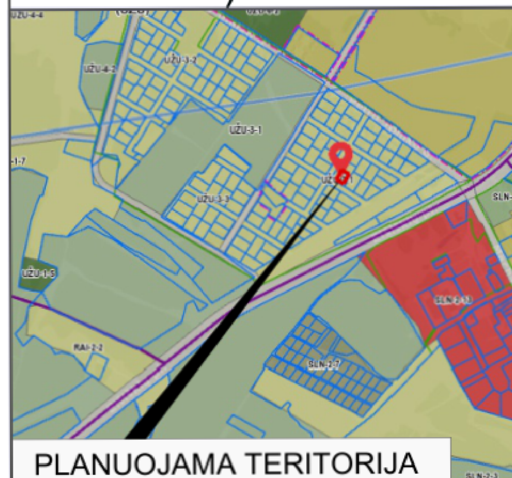
PLANUOJAMA TERITORIJA SITUACIJOS SCHEMA (VILNIAUS M. SAV. TERIT. BP KONTEKSTE)

2001-02-28 Vilniaus miesto tarybos sprendimu Nr. 235 patvirtinto detaliojo plano "Dėl pritarimo Vilniaus miesto bendrojo plano sprendinių tikslinimui ir teritorijos (34 ha sklypo) Eišiškių pl. 127 detaliojo plano sprendinių tvirtinimo" koregavimas (statinių statybos zonos, ribos, susisiekimo komunikacijų išdėstymo principų koregavimas sklype: adresu A. Kuršaičio g. 12A, Vilnius)