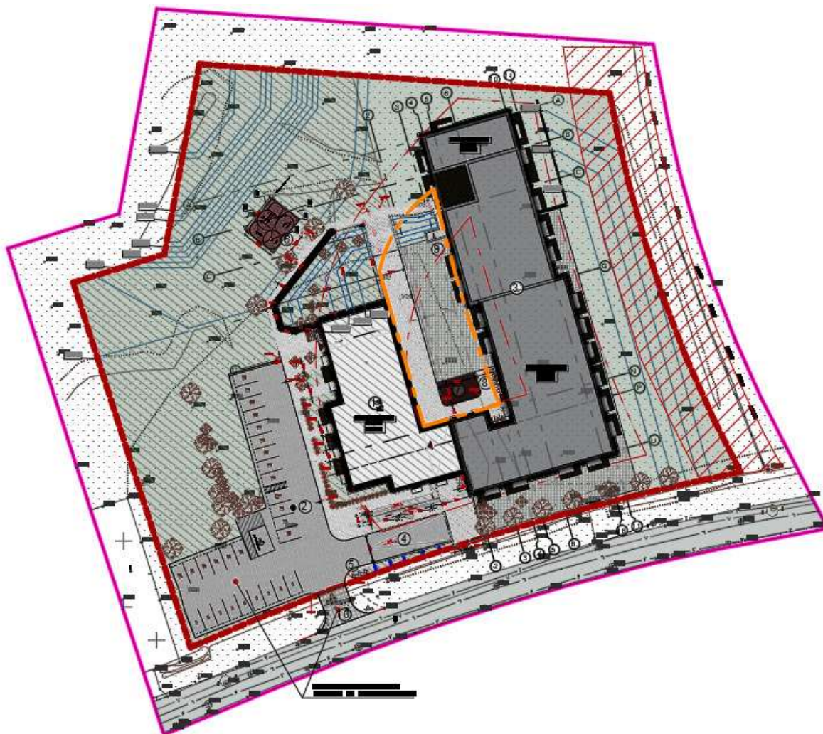
5 pav. Ištrauka iš Daugiabučio gyvenamojo namo Duburio g. 4, Vilniuje, statybos projekto sklypo plano brėžinio

Koreguojama statinių statybos zona ir jos riba esanti statinių statybos zonos viduryje (žiūr. 5 pav.). Rytinė statinių statybos zonos dalis praplečiama iki 11 m per visą ilgį. Šiaurės vakarinėje dalyje statinių statybos zona sumažinama per 5,63 m.