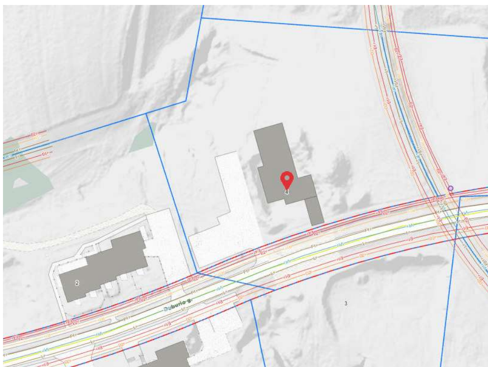
2 pav. Ištrauka iš https://maps.vilnius.lt/teritoriju-planavimas#layers

Teritorija yra inžineriškai išvystyta. Šalia sklypo Duburio g. yra elektros, dujų, vandentiekio, buitinių ir lietaus nuotekų, ryšių tinklai. Planuojamoje teritorijoje ir gretimuose sklypuose yra esamų statinių.