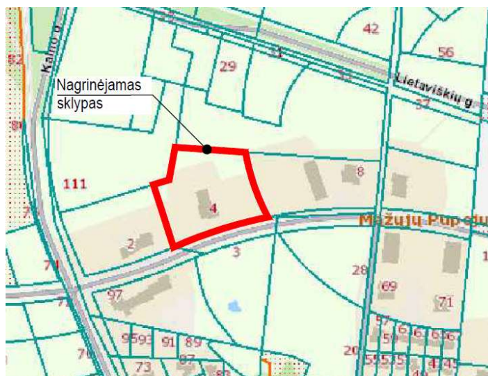
1 pav. Ištrauka iš https://regia.lt

Teritorija yra inžineriškai išvystyta. Šalia sklypo Duburio g. yra elektros, dujų, vandentiekio, buitinių ir lietaus nuotekų, ryšių tinklai. Planuojamoje teritorijoje ir gretimuose sklypuose yra esamų statinių.