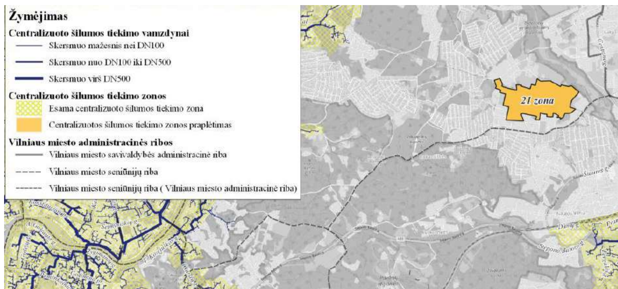
6 pav. Ištrauka iš atnaujinto Vilniaus miesto šilumos ūkio specialiojo plano keitimo

patenka į centralizuoto šilumos tiekimo zoną (Nr. 21, Pupojai), todėl planuojamą pastatą numatoma šildyti prisijungiant prie miesto centrinio šildymo.