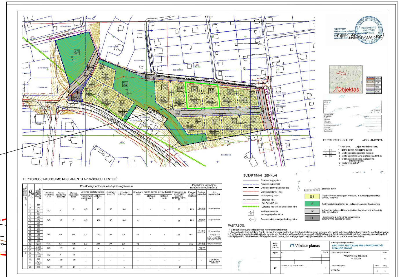
Apie 2,4 ha teritorijos prie Liškiavos gatvės detalusis planas