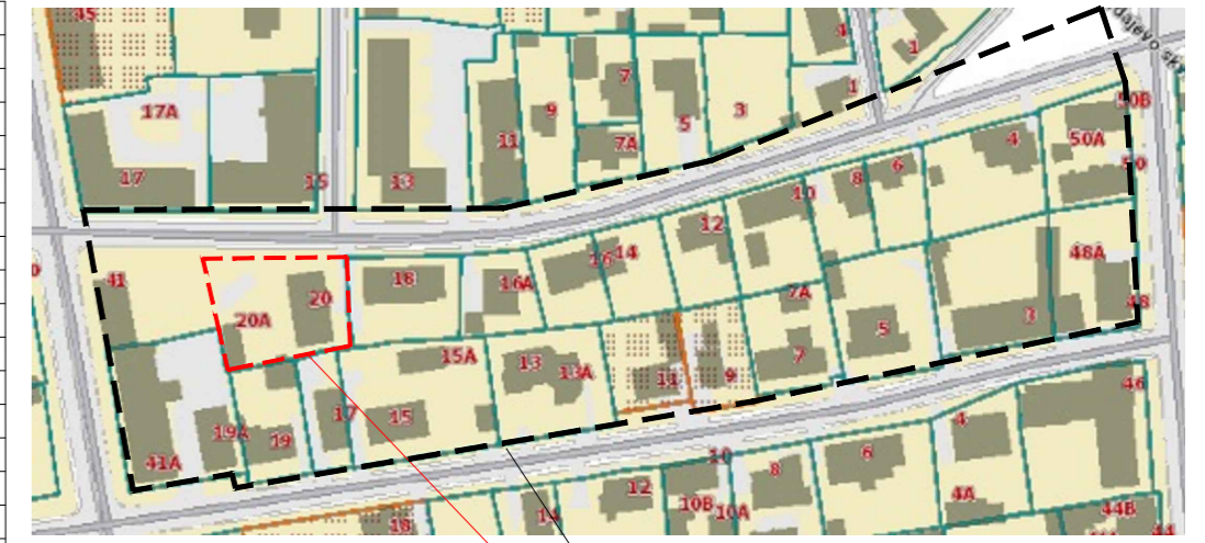
KOREGUOJAMA DETALIOJO PLANO DALIS PLANUOJAMA TERITORIJA