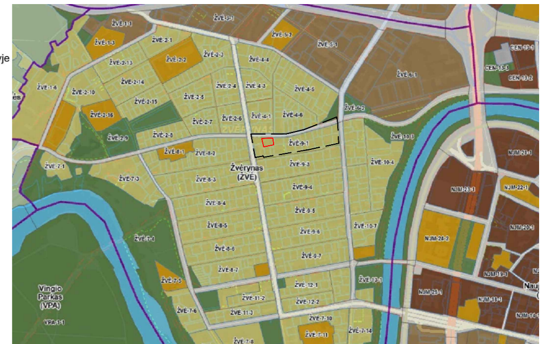
Ištrauka iš Vilniaus miesto savivaldybės teritorijos bendrojo plano pagrindinio brėžinio iki 2030

Topografinių ir inžinerinės infrastruktūros objektų erdvinių duomenų ir kitos informacijos gavimas Paslauga įvykdyta Prašymo numeris: THIS2-20220805-038251 Prašymo data: 2022-08-05 17:02