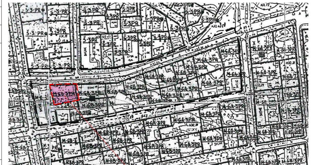
KOREGUOJAMA DETALIOJO PLANO DALIS PLANUOJAMA TERITORIJA