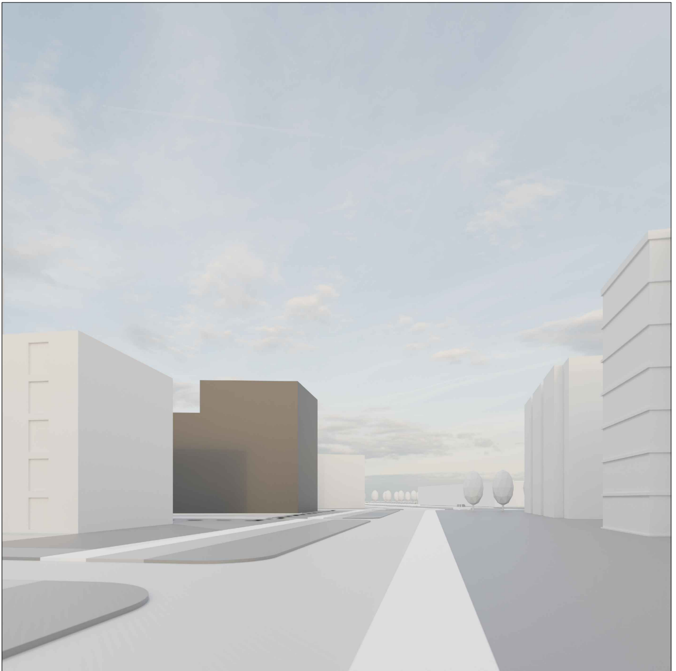
Vaizdas iš Grigalaukio gatvės.