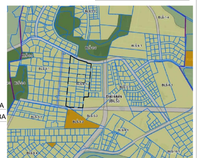
Ištrauka iš Vilniaus miesto savivaldybės teritorijos bendrojo plano pagrindinio brėžinio Nr. 2030