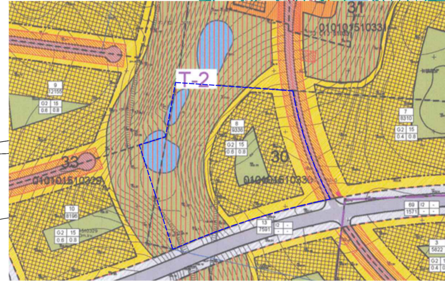
Ištrauka iš „Teritorijos buvusiame Pupojų kaime (Pagal Pupojų rajono urbanistinės plėtros koncepciją, pažymėtą indeksais T1, T2, T3, T4, T7, T10, T12, T13) detalusis planas“, patvirtintas 2009 m. gegužės mėn. 21 d. Vilniaus miesto savivaldybės tarybos sprendimu Nr.1-1029. Koreguojama teritorija - sklypas Nr. 8.