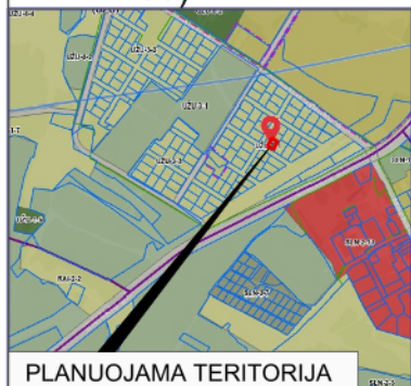
PLANUOJAMA TERITORIJA SITUACIJOS SCHEMA (VILNIAUS M. SAV. TERIT. BP KONTEKSTE)

2001-02-28 Vilniaus miesto tarybos sprendimu Nr. 235 patvirtinto detaliojo plano "Dėl pritarimo Vilniaus miesto bendrojo plano sprendinių tikslinimui ir teritorijos (34 ha sklypo) Eišiškių pl. 127 detaliojo plano sprendinių tvirtinimo" koregavimas (statinių statybos zonos, ribos, susisiekimo komunikacijų išdėstymo principų koregavimas sklype: adresu A. Kuršaičio g. 12A, Vilnius)